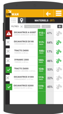
Gestion de parc