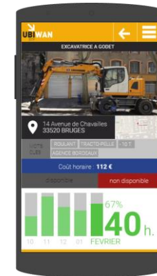
Disponibilité des équipements